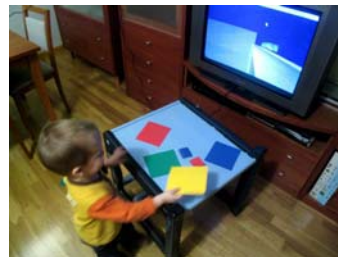
Figura 2. Cartulinas de colores como elementos tangibles.

La relación “elementos tangibles” – imagen virtual en el televisor, puede materializarse de dos formas: