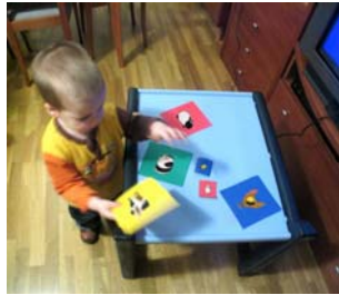
Figura 4. Cartulinas con los animales de granja

En pantalla, el escritorio vacío es visualizado como una pradera con un edificio de establo en un lateral. Cuando éste coloca alguna cartulina de algún animal, el sistema la reconoce y la visualiza en pantalla con un avatar 3D animado de dicho animal. Este emite los sonidos habituales de ese tipo de animal.