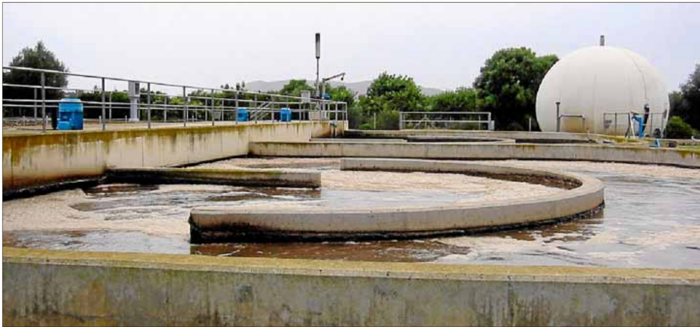
Reactor biológico de tratamiento de aguas residuales para producir agua reutilizable en el ambiente y residuo sólido o fango. / BIOTHYS

Biothys cuenta con un laboratorio de investigación y desarrollo especializado en el estudio y aplicación de compuestos moleculares activos para el tratamiento de las molestias olfativas por vía química y biológica. Sus productos no son enmascaradores, sino inhibidores del olor. Por Elena Soto