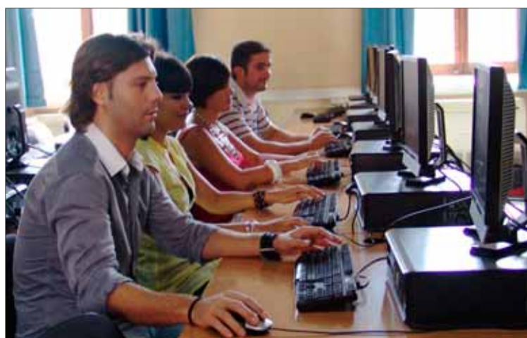
Grupo de Promotores Tecnológicos de la pasada edición.

El programa, dirigido a estudiantes de último curso y titulados universitarios ha diseñado un progra-