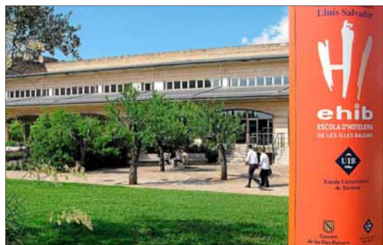
Vista de la Escuela Universitaria de Turismo.

En esta segunda edición del congreso se analizarán los retos que tiene que afrontar el turismo en el actual contexto de globalización, y en este sentido los ponentes abordarán múltiples