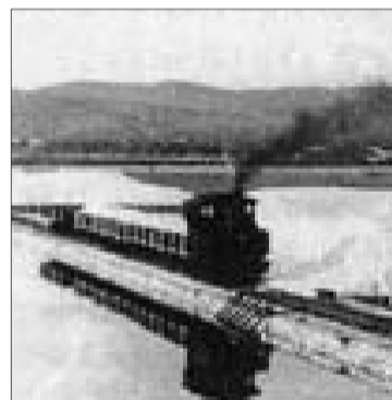
Tren cruzando las salinas.

les. Se crearon más de 25 kilómetros de terreno para dividir estanques, otros ocho de canales, se construyeron tres puertos y se mecanizó el trabajo», enumera Fernández. En 1896 se introdujo además el tren que iba desde los estanques hasta la zona de apilamiento y desde allí, al puerto privado de La Canal. Fruto de aquellas mejoras la producción pasó de 6.000 toneladas anuales a 55.000 en apenas dos décadas. El destino principal de la sal era el mismo que en la actualidad cuando un 60 por ciento se destina a Holanda, Reino Unido y Dinamarca.