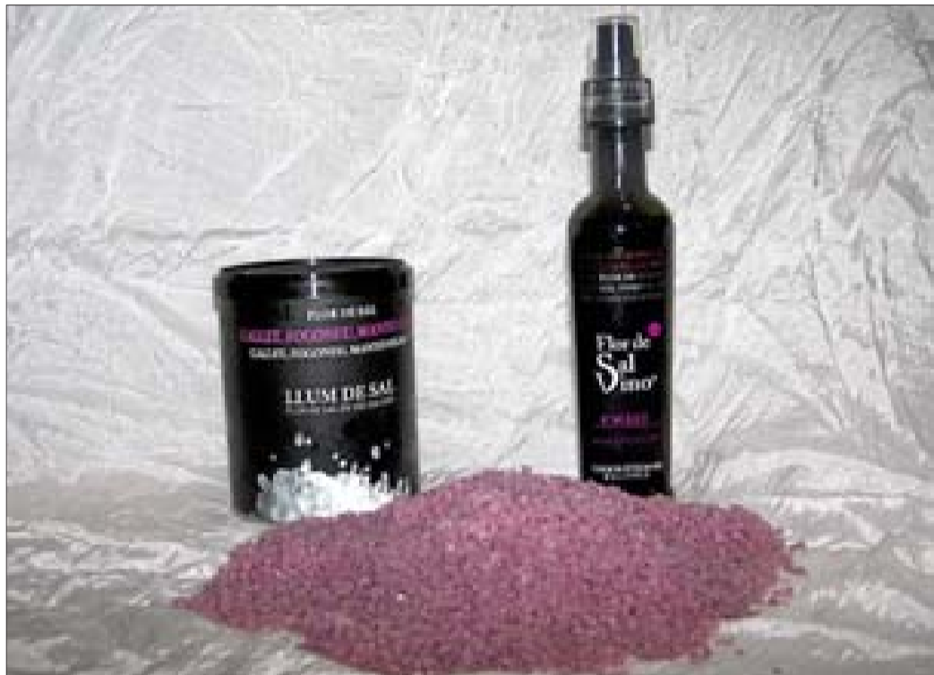
Sal en estado sólido y líquido elaborada con vino de diferentes variedades autóctonas de Baleares.