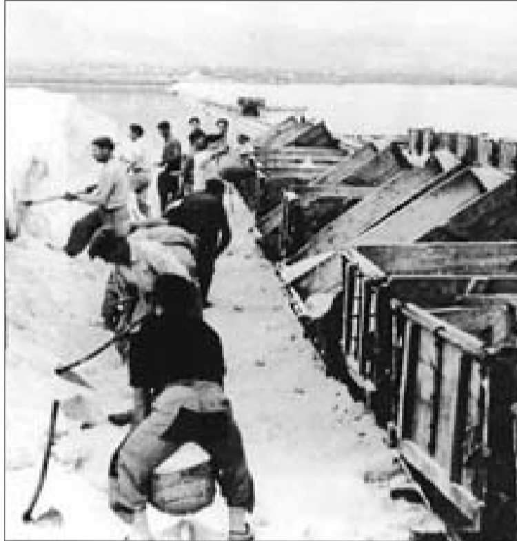
Recolección tradicional de sal en las salinas de Ibiza.

Eugenio Molina —un ingeniero de minas de Granada— fue el artífice del reflotamiento de las salinas ibicencas. «Las inversiones fueron bruta-